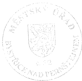
Ing. František Klimeš vedoucí odboru životního prostředí

Proti tomuto rozhodnutí může účastník řízení podat podle ustanovení § 81 odst. 1 správního řádu odvolání ve lhůtě 15 – ti dnů ode dne jeho oznámení ke Krajskému úřadu Kraje Vysočina, Žižkova 57, 586 01 Jihlava, a to podáním učiněným u odboru životního prostředí Městského úřadu Bystřice nad Pernštejnem. Podané odvolání má odkladný účinek.