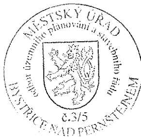
Ing. Tomáš Straka vedoucí odboru

Rozhodnutí má podle § 93 odst. 1 stavebního zákona platnost 2 roky. Podmínky rozhodnutí o umístění stavby platí po dobu trvání stavby či zařízení, nedošlo-li z povahy věci k jejich konzumaci.