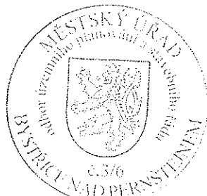
Ing. Tomáš Straka vedoucí odboru

Rozhodnutí má podle § 93 odst. 1 stavebního zákona platnost 2 roky. Podmínky rozhodnutí o umístění stavby platí po dobu trvání stavby či zařízení, nedošlo-li z povahy věci k jejich konzumaci.